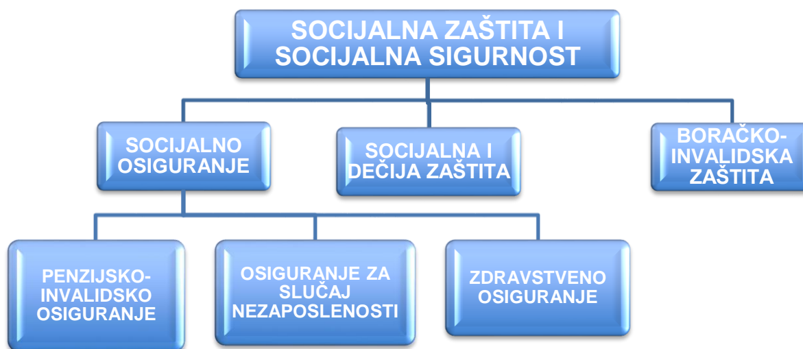
Grafikon 1. Socijalna zaštita i socijalna sigurnost u Srbiji

Evropska unija je razvila veliki broj indikatora za ocenu i praćenje sistema socijalne zaštite i socijalne sigurnosti. Među indikatorima, jedan manji broj se odnosi na sagledavanje socijalne zaštite i socijalne sigurnosti u celini. U tekstu koji sledi i poglavlju 5 su analizirani EU indikatori koji pre svega omogućavaju da se proceni i prati obim intervencije i održivost sistema socijalne zaštite i socijalne sigurnosti, kao i efektivnost socijalnih transfera. U poglavljima 4 i 6 su predstavljeni predloženi nacionalno specifični indikatori, ali i dodatni indikatori koji su razrađeni u pojedinim evropskim dokumentima.